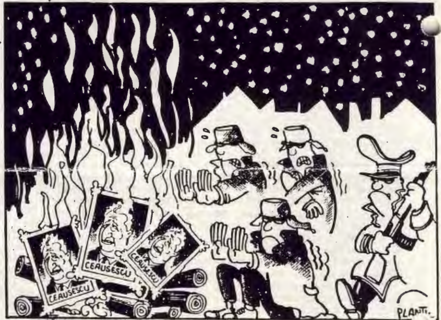
La caricature est parue dans "Le Monde" du 24.11.87

Les rares élections organisées dans le pays fournissent également aux mécontents une occasion de s'exprimer. Ainsi, des oppositions inhabituellement fortes s'étaient révélées pendant les élections à la « Grande Assemblée nationale », le 17 mars 1985. Selon les résultats officiels, 2,3 % de l'électorat s'était prononcé contre les candidats présentés par le « Front de l'unité et de la démocratie socialiste », contre à peine 1,5 % en 1980. Ces taux moyens étaient bien sûr largement dépassés – presque triplés – dans les régions à forte concentration allemande ou hongroise.