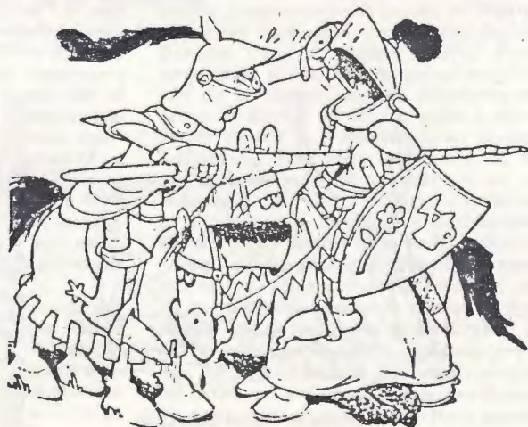
(Desen reproduș după revista "LIRE")